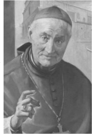
Fondatore delle Suore Maestre Dorotee S. Giovanni Antonio Farina

Ogni giorno alla Madonna chiedo umilmente di donarmi il Suo Cuore, il Suo Amore e la Sua capacità di lode per ripetere al Buon Dio come Lei il 'mio' magnificat per ciò che Egli desidera fare in me e con me, nonostante la mia povertà personale. Amo molto il S. Rosario, in particolare ad ogni "Ave Maria" supplico l'amata Mamma del Cielo ad essermi accanto in ogni istante di mia vita, ma in modo speciale nell'ora della mia chiamata al Cielo e mi accompagni ad abbracciare finalmente - con immensa riconoscenza - il Suo divino Figlio e mio adorato Sposo, Gesù, vivere eternamente felice con Lui!